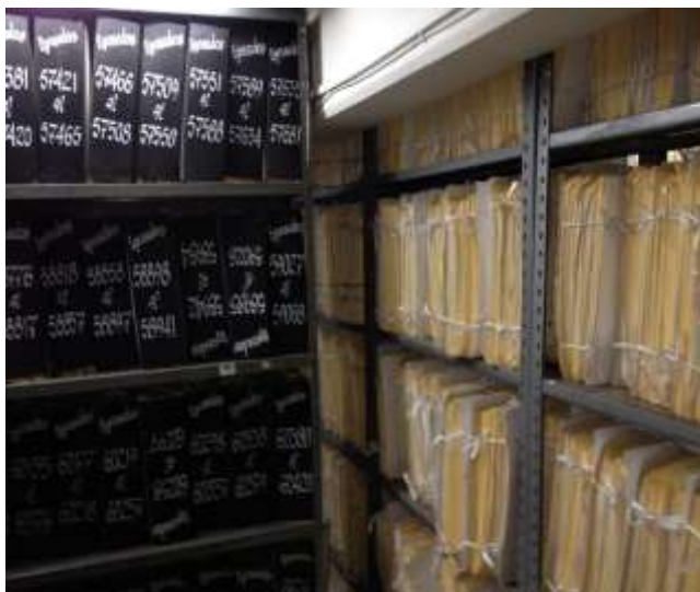
Figura: Estantes con carpetones