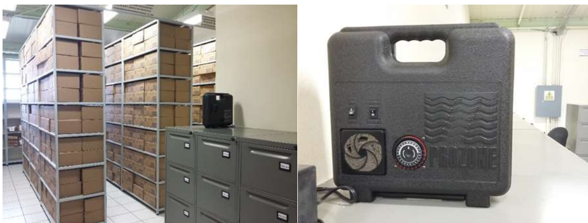
Figura 4 : Purificador de aire “PROZONE TWISTER”.

Este dispositivo es con el objeto de que el área de acervo documental esté libre de microbios y microorganismos que afecten su conservación.