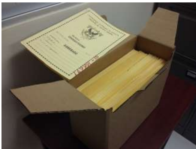
Figura: Caja libre de ácido abierta