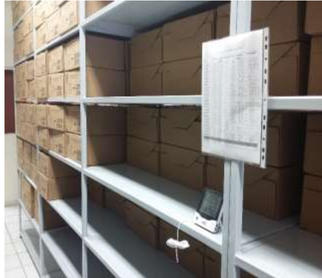
Figura 1: Termo-higrómetro colocado en pared Figura 2: Termo-higrómetro colocado en estante

Ante esta situación a partir de esa fecha se acuerda: