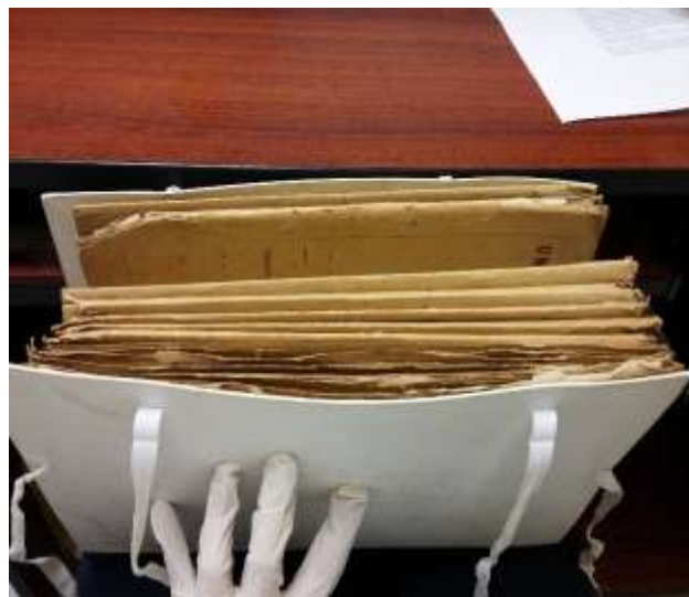
Figura: Carpetón individual