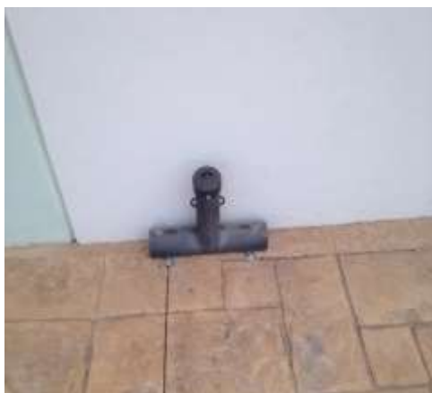
Figura 9: Estación cebadera individual.

La fumigación es un procedimiento necesario que debe realizarse en forma periódica en las áreas de acervo documental. Se colocaron 8 depósitos de estación cebadera (figura 9 y 10) en todo el perímetro de las instalaciones de Archivo General e contra ratas y animales rastreros, esto debido a que el hábitat que nos circunda es de río y maleza, el mantenimiento de estas es recomendable se realice cada 3 meses.