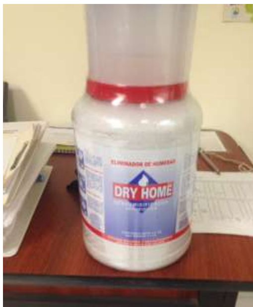
Figura 3 : Deshumidificador “Dry Home”.