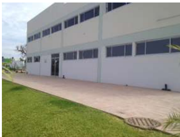
Figura 10: Dos estaciones cebaderas.