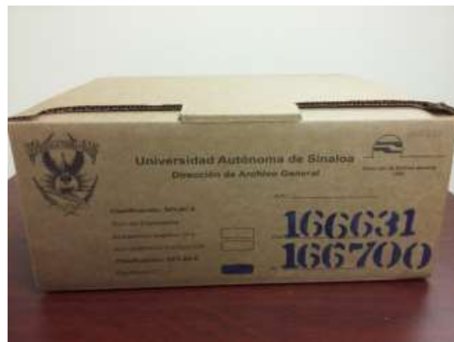
Figura: Caja libre de ácido con imagen institucional

A partir de dicha fecha siempre se solicitan las requisiciones de forma permanente, de este tipo de cartón para el almacenamiento de los expedientes.