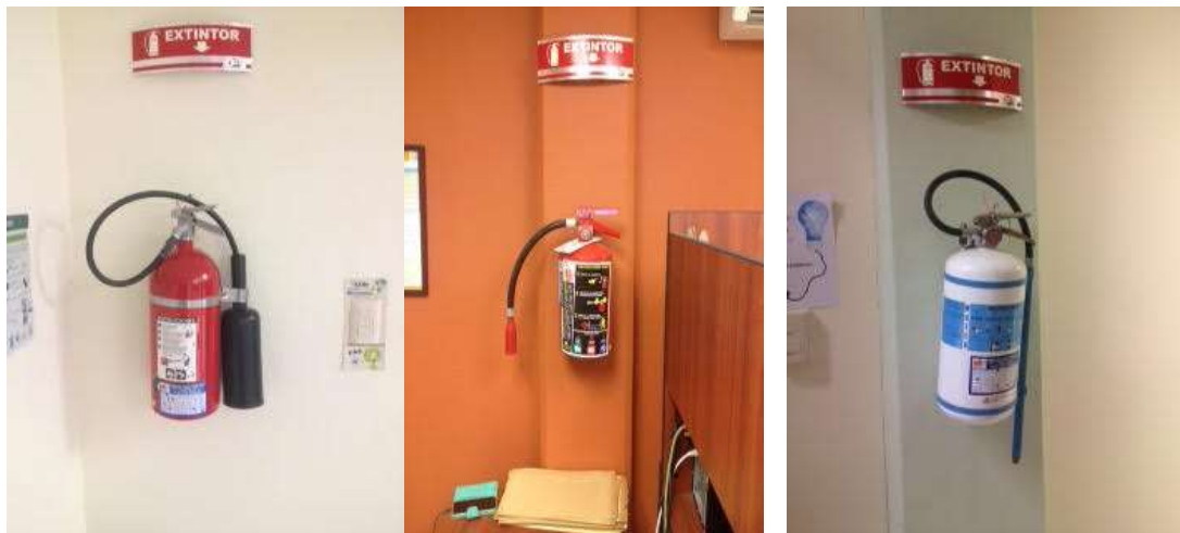
Figura 8 : Extintores en orden de aparición, “GAS BC”, “PQS ABC” y “ESPUMA AC”.

Extintor Espuma AC: Este tipo de extintor es utilizado para combatir fuego clase “A” que se presenta en material combustible sólido, generalmente de naturaleza orgánica, y que su combustión se realiza normalmente con formación de brasas, así como también fuego clase “C” en el que se involucra aparatos, equipos e instalaciones eléctricas energizadas. 3