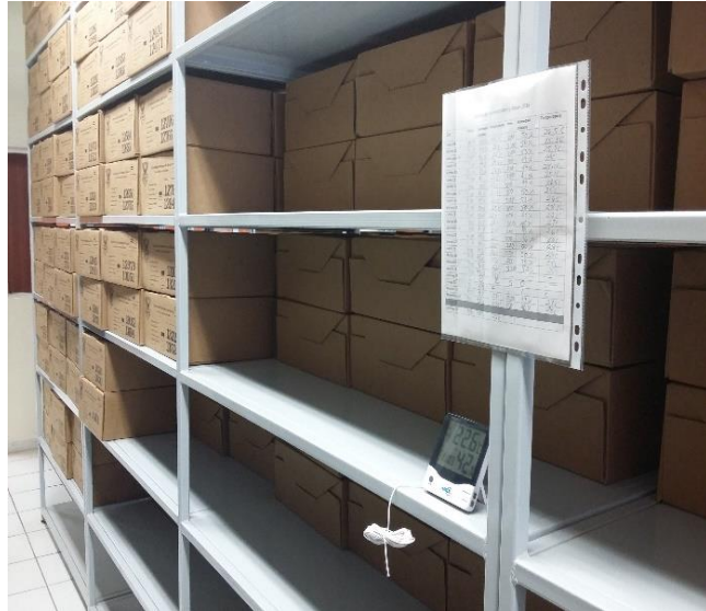
Figura 1: Termo-higrómetro colocado en pared Figura 2: Termo-higrómetro colocado en estante

Ante esta situación a partir de esa fecha se acuerda: