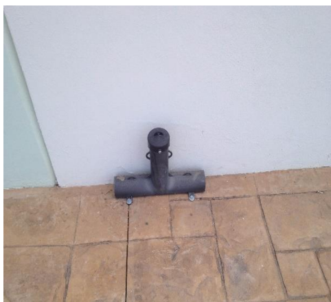
Figura 9: Estación cebadera individual.

La fumigación es un procedimiento necesario que debe realizarse en forma periódica en las áreas de acervo documental. Se colocaron 8 depósitos de estación cebadera (figura 9 y 10) en todo el perímetro de las instalaciones de Archivo General e contra ratas y animales rastreros, esto debido a que el hábitat que nos circunda es de río y maleza, el mantenimiento de estas es recomendable se realice cada 3 meses.