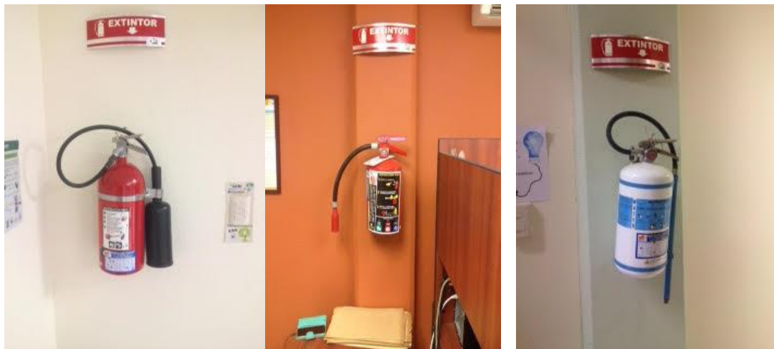
Figura 8 : Extintores en orden de aparición, “GAS BC”, “PQS ABC” y “ESPUMA AC”.

Extintor Espuma AC: Este tipo de extintor es utilizado para combatir fuego clase “A” que se presenta en material combustible sólido, generalmente de naturaleza orgánica, y que su combustión se realiza normalmente con formación de brasas, así como también fuego clase “C” en el que se involucra aparatos, equipos e instalaciones eléctricas energizadas. 3