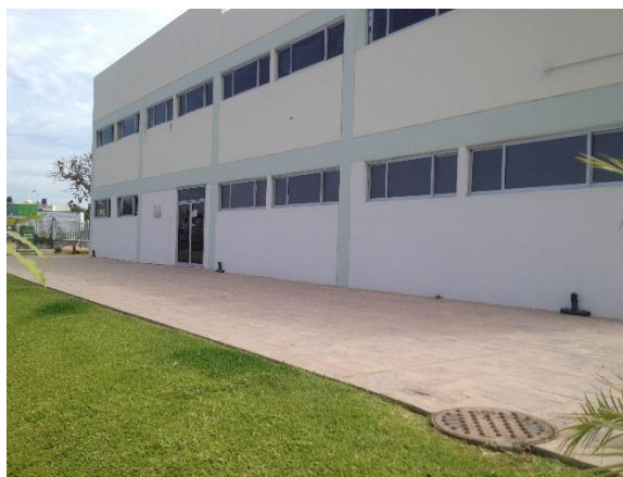
Figura 10: Dos estaciones cebaderas.