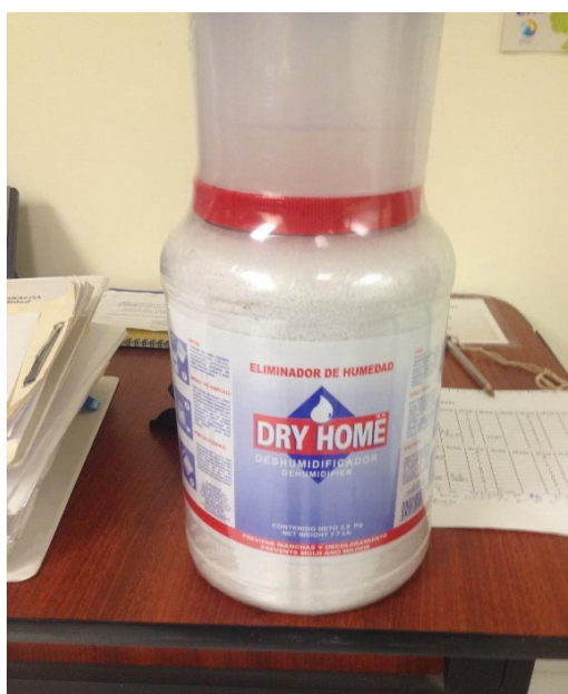
Figura 3 : Deshumidificador “Dry Home”.