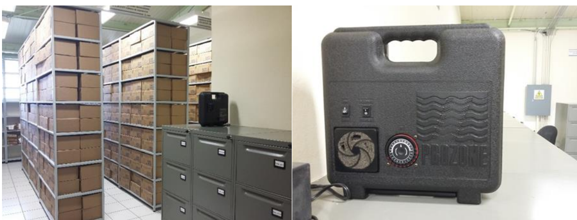
Figura 4 : Purificador de aire “PROZONE TWISTER”.

Este dispositivo es con el objeto de que el área de acervo documental esté libre de microbios y microorganismos que afecten su conservación.